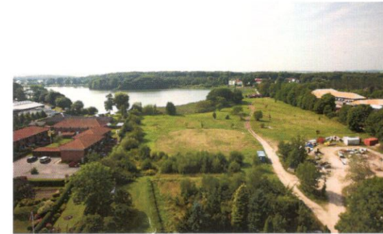
Udsigt mod syd fra Vestergade over det gamle gartneri, med Lillesø og Dyrehaven i baggrunden